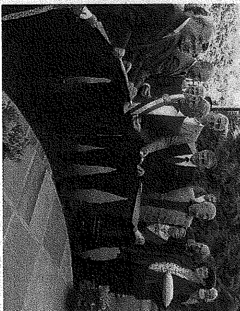
Il n'a pas été facile d'assister au couper de ruban à l'entrée de la mairie rénovée !

mieux adaptés en a permis la rénovation, la création d'une grande salle de conseil, et de bureaux et toilettes correspondant mieux aux besoins actuels. A l'étage, 4 appartements locatifs ont été aménagés.