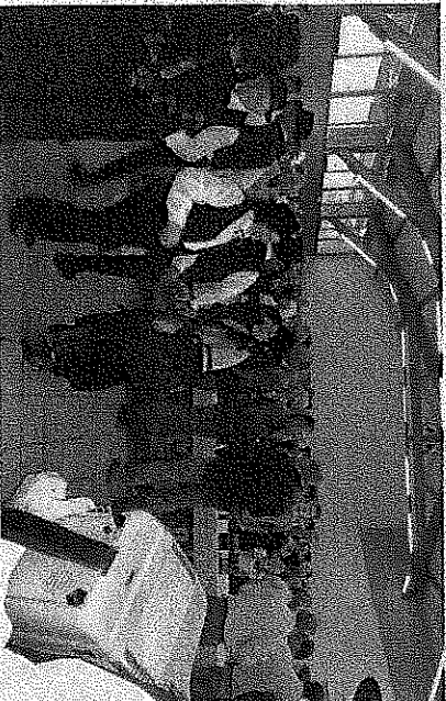
Le groupe folklorique savoyard avait proposé spontanément d'animer l'inauguration.